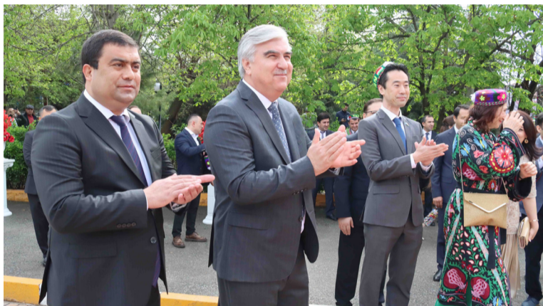
БАЗМИ НАВРҶЗӢ ДАР ВАЗОРАТИ МОЛИЯ

Нашрияти Донишгоҳи давлатии молия ва иқтисоди Тоҷикистон